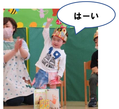
2さいになりました