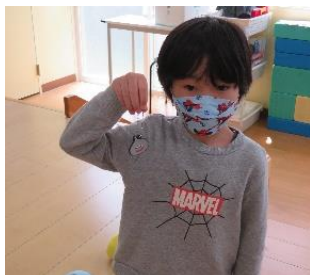
なんと!キーホルダー!!