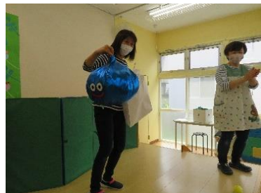
さすが園長先生!メタリックですねヾ(≧▽≦)ノ