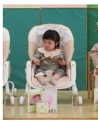
1さいになりました