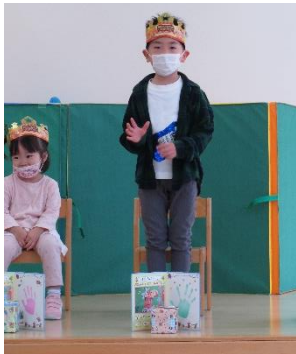
6さいになりました