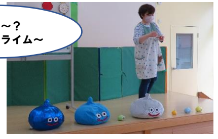
勇者達が見つけてくれました。