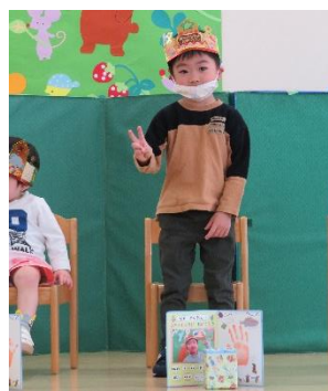
4さいになりました