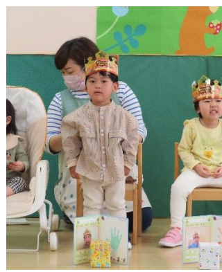
2さいになりました