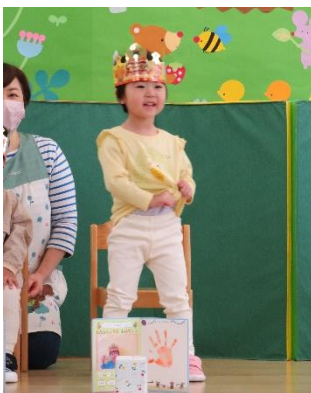
3さいになりました