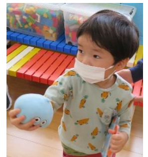
みずいろスライム