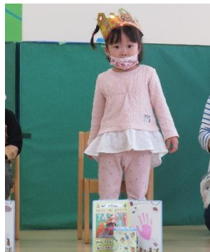
4さいになりました