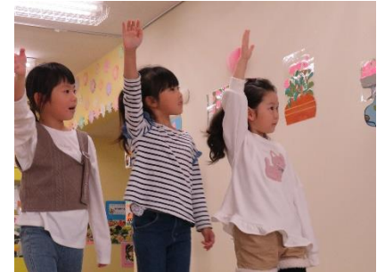
途中からは左を見て渡ります