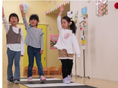
道路の途中までは、右を見て